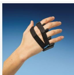
Mediroyal NRX ulnardeviationsortos ● Beställningsvara