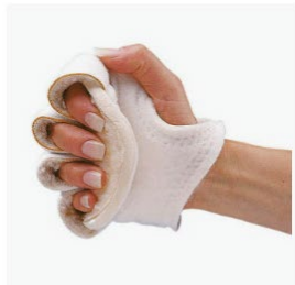
Camp Scandinavia Handflatsskydd med fingerdelare ● Beställningsvara