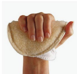
Camp Scandinavia Handflatsskydd ● Beställningsvara